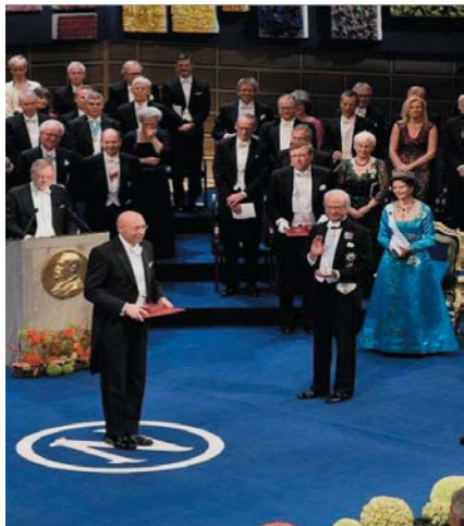
Stefan Hell vom MPI für biophysikalische Chemie erhält in Stockholm den Nobelpreis für Chemie.